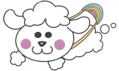
みまもりわんこ クードル